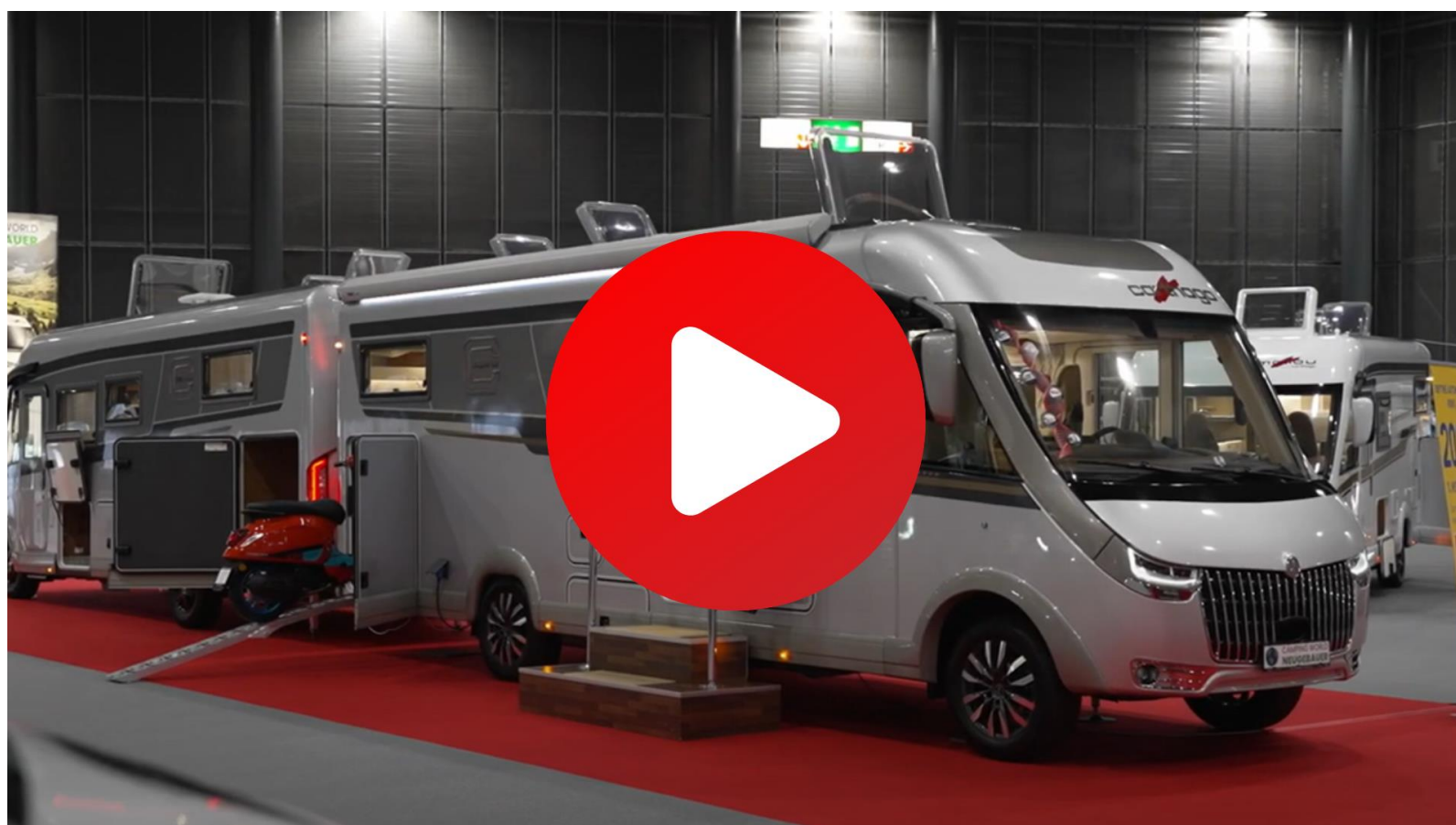
Caravaning Brno 2023