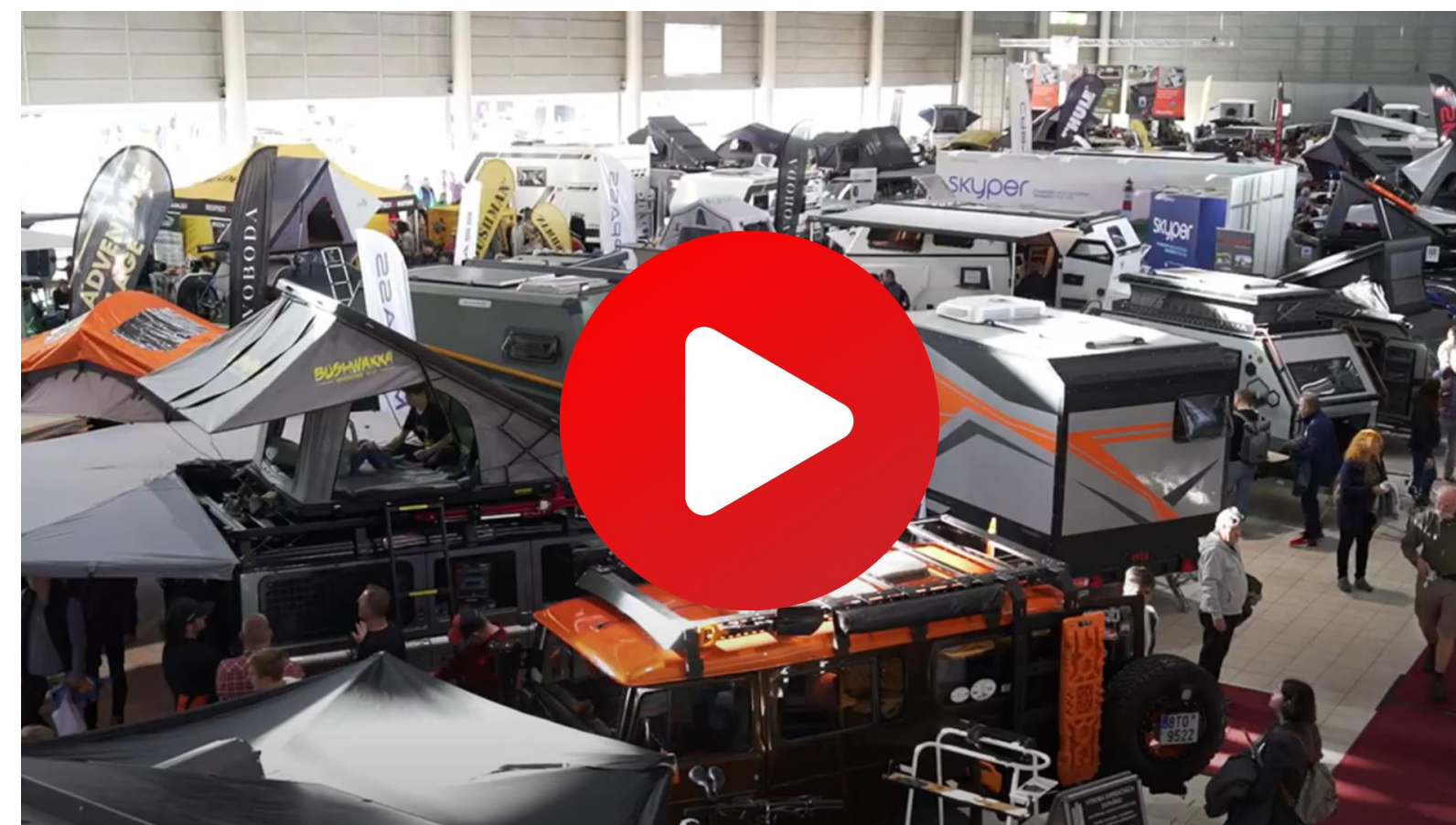
Adventure Hall na Caravaningu Brno 2023